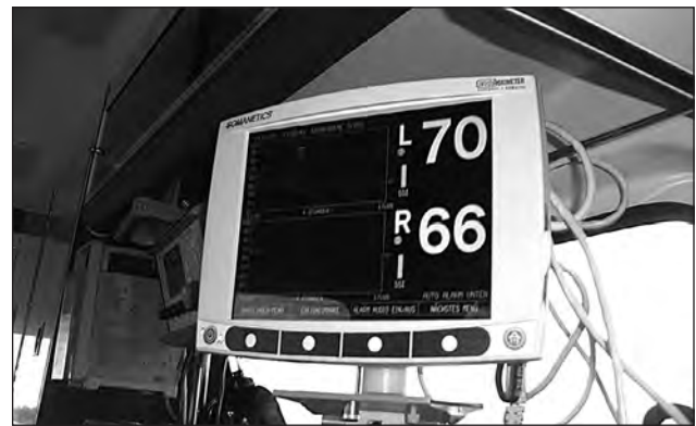
Abb. 2: Befestigung des INVOS-Gerätes im ITW.

Das Gerät konnte sicher im Intensivtransportwagen befestigt werden, die Ableitungen bei den Patienten waren störungsfrei (Abb. 2 und Abb. 3).