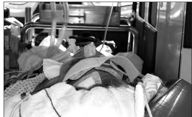
Abb. 3: Elektrodenplatzierung.

Der vom Hersteller angegebene Normbereich wurde in keinem Fall unterschritten.